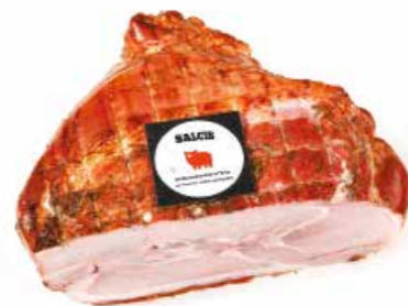
Prosciutto arrosto alla griglia PG001 Kg. 6