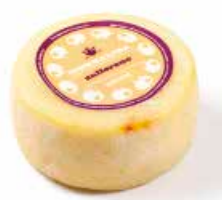
Monnalisa Zafferano ML044 gr. 500