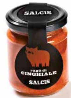
Ragù di Cinghiale RG003 gr. 180