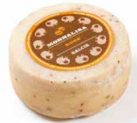
Monnalisa Noce ML048 Kg. 1