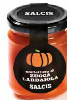
Confettura di Zucca C008 gr. 212 C008P gr. 40