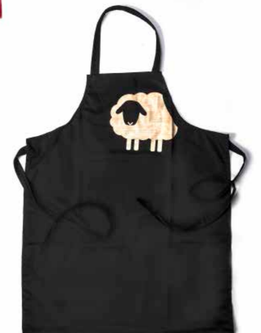
Grembiule Pecora GRP01