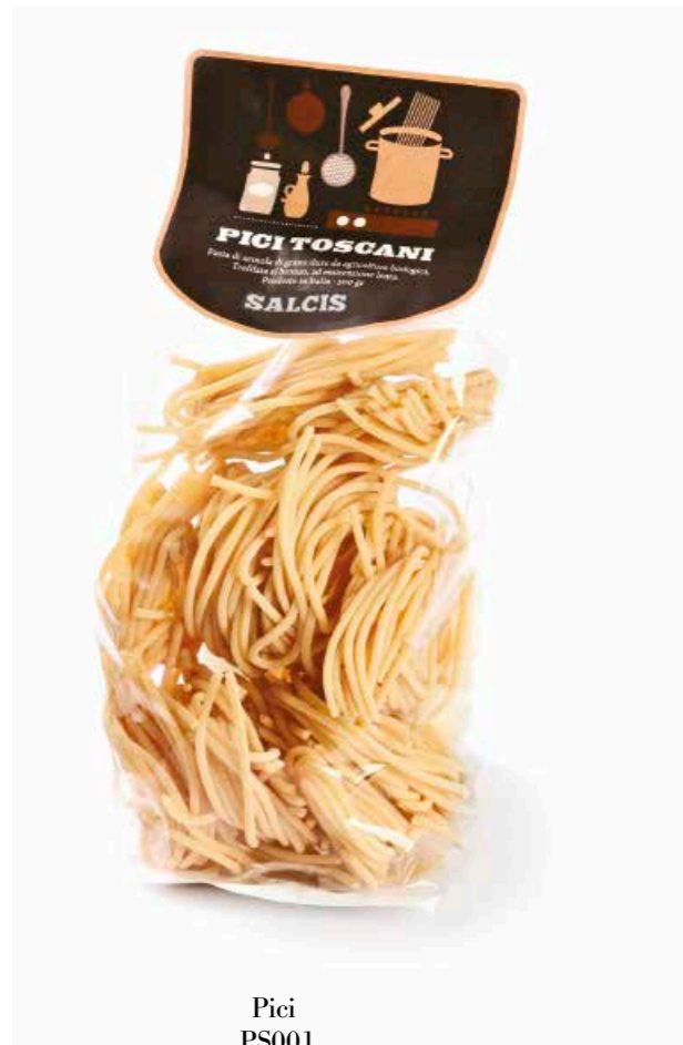
Pici PS001 gr. 500