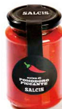
Salsa Piccante PM003 gr. 340