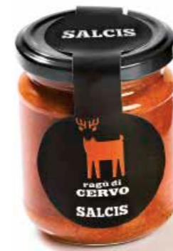
Ragù di Cervo RG001 gr. 180