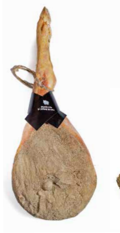
Prosciutto di Maiale Grigio PR099 Kg. 8