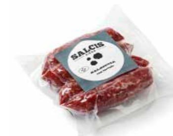
Salsiccia stufata al Tartufo bustina 4 pz. sottovuoto SMB05