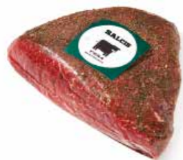
Fesa marinata CH001 Kg. 2