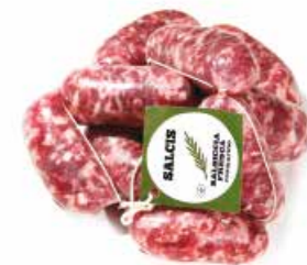
Salsiccia con rosmarino SF003