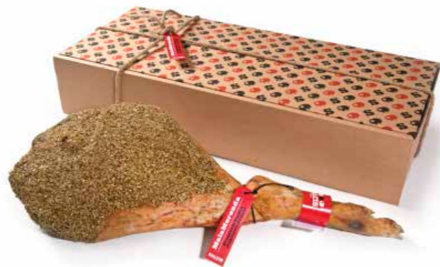
Prosciutto stagionato 24 mesi "Malamerenda" PRM01 Kg. 10