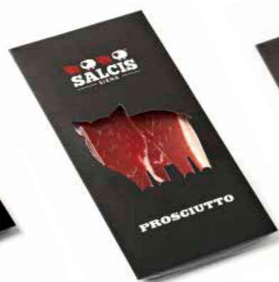
Prosciutto in astuccio s.v. PRAS02 Gr. 80