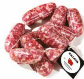
Salsiccia Siena SF001