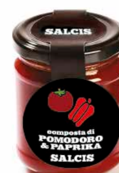
Composta di Pomodoro e Paprika C021 gr. 212 C021P gr. 40