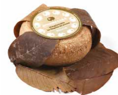
Monnalisa stagionato in foglie di noce ML082 Kg. 1,2