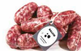
Salsiccia con tartufo SF005