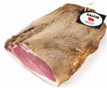
Pancetta tesa PT001 Kg. 2,5