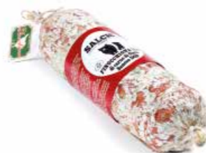
Finocchiona IGP da "Cinta senese DOP" CSF07 gr. 500