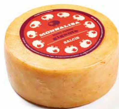
Monnalisa Gigante tinto rosso ML010 Kg. 3