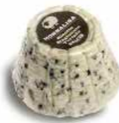
Ricottina Stagionata Tartufo RST03 gr. 180