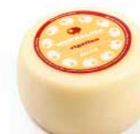
Monnalisa Rigatino ML007 gr. 500