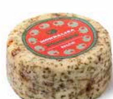
Monnalisa Pizzaiola ML059 gr. 500