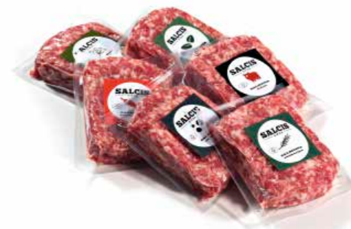
Salsiccia in pasta sottovuoto gr. 300 Siena SFP01 Peperoncino SFP02 Rosmarino SFP03 Finocchio SFP04 Tartufo SFP05 Salvia SFP06