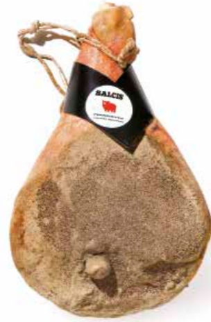
Prosciutto tipo Siena PR002 con osso Kg. 9