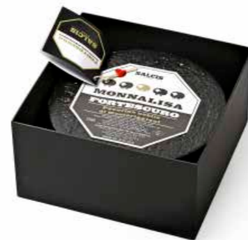
Monnalisa "Fortescuro" Millesimato prodotto in primavera ML089 Kg. 2,6