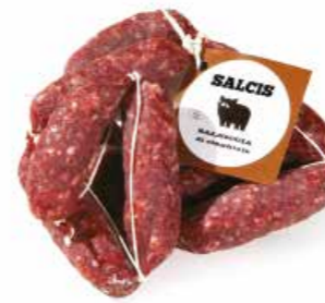
Salsiccia di Cinghiale CG001