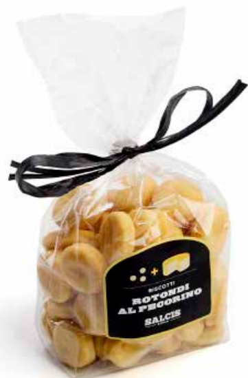
Biscotti rotondi al Pecorino B002 gr. 180