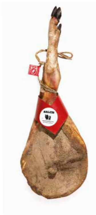
Prosciutto da "Cinta senese DOP" CS001 Kg. 8