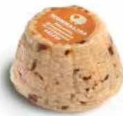
Ricottina Stagionata Peperoncino RST02 gr. 180