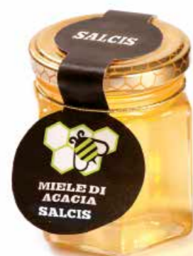
Miele di Acacia MEA01 gr. 250 MEAP1 gr. 40