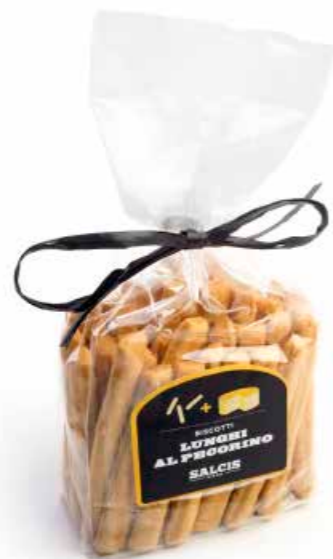
Biscotti lunghi al Pecorino B003 gr. 180