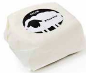
Monnalisa Fiorita ML058 Kg. 0,3