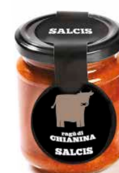
Ragù di Chianina RG008 gr. 180