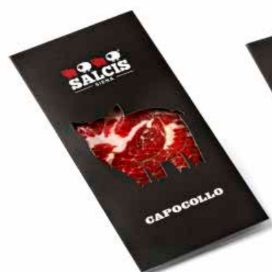
Capocollo in astuccio s.v. CPAS01 Gr. 80