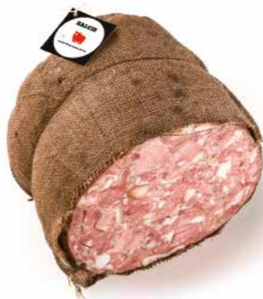
Soppressata gigante in juta SP003 Kg. 16 Soppressata gigante in juta al Tartufo SP004 Kg. 16 Soppressata gigante in juta al Prezzemolo SP005 Kg. 16 Soppressata gigante in juta al Peperoncino SP006 Kg. 16