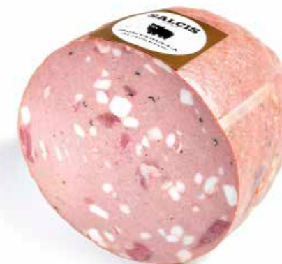
Mortadella di Cinghiale sottovuoto MC001 Kg. 3,5