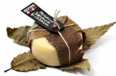
Pecorino sotto Foglie di Castagno MLC93 gr. 500