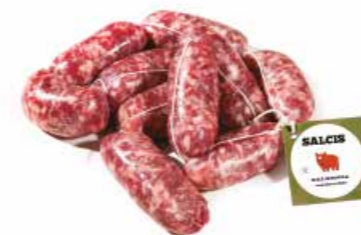
Salsiccia con finocchio SF004