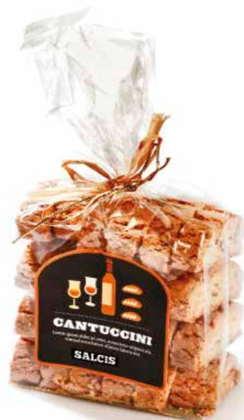
Cantuccini B001 gr. 300