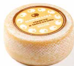
Monnalisa Riserva al latte crudo ML083 Kg. 1,5