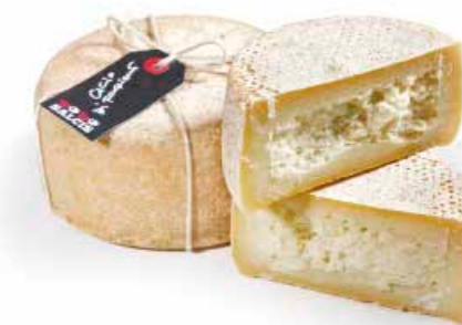
Cacio di Fogliano a latte crudo FG001 Kg. 1,2