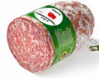
Finocchiona IGP FN003 Kg. 4,5