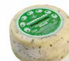
Monnalisa Dragoncello ML061 gr. 500