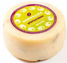
Monnalisa Pistacchio MLG47 Kg. 1