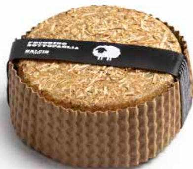
Pecorino Sotto Paglia cod MLC88AS gr 500