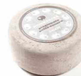
Monnalisa stagionato sotto cenere ML086 Kg. 1,5