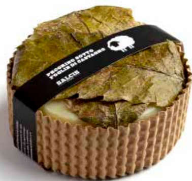
Sotto Foglie di Castagno cod MLC82AS gr 500