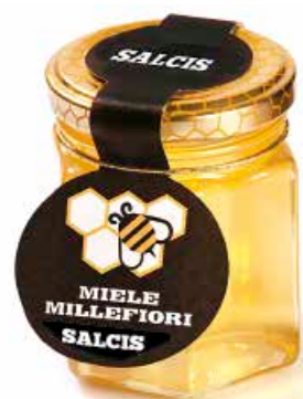
Miele Millefiori MEM01 gr. 250 MEMP1 gr. 40