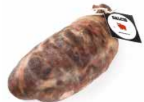
Buristo BR001 Kg. 2