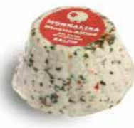
Ricottina Stagionata Aglio, Olio e Peperoncino RST04 gr. 180