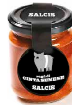
Ragù di Cinta RG007 gr. 180