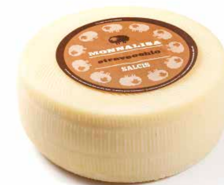
Monnalisa "Stravecchio" ML085 Kg. 6