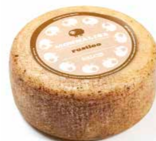
Monnalisa Rustico stagionato ML008 Kg. 1,8