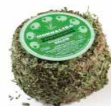
Aromatizzato al Dragoncello ML054 gr. 500