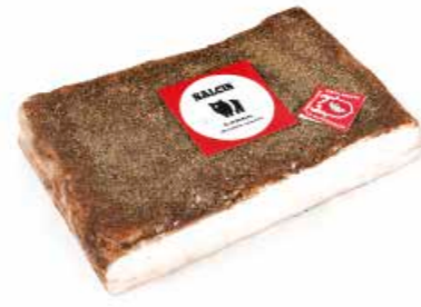
Lardo da "Cinta senese DOP" CS006 Kg. 2,5