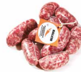
Salsiccia con peperoncino SF002