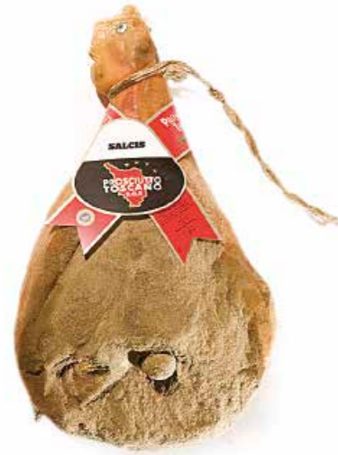
Prosciutto DOP PR001 con osso Kg. 9