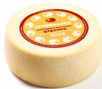
Monnalisa Gigante ML009 Kg. 3