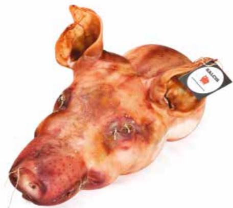
Testina di suino ripiena TS001 Kg. 10 / 12