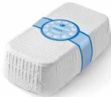
Monnalisa Fresco FML1 Kg. 2