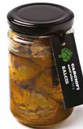
Carciofi sott'olio S001 gr. 270