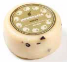
Monnalisa Olive ML046 gr. 500