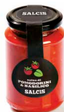
Salsa Pomodorini e Basilico PM002 gr. 340