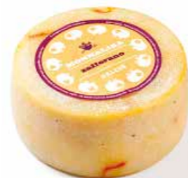
Monnalisa Zafferano MLG44 Kg. 1