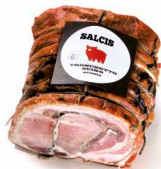
Tronchetto di suino arrosto TR001 Kg. 14