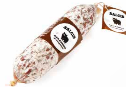
Salamino di Cinghiale CG002 gr. 500