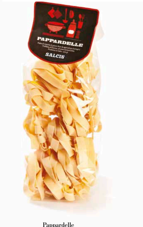
Pappardelle PS002 gr. 500