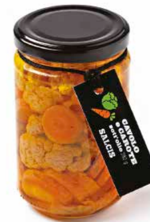
Cavolo e Carote sott'olio S011 Cavolo e Carote