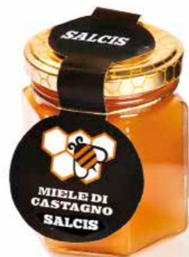
Miele di Castagno MEC01 gr. 250 MECP1 gr. 40