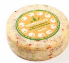
Monnalisa Aglio, Olio e Peperoncino MLG40 Kg. 1