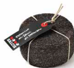
Pecorino ai semi di Papavero MLC30 gr. 500