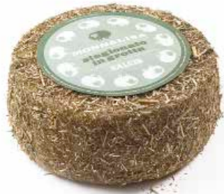
Monnalisa stagionato in grotta ML087 Kg. 2,6 Grottino MLP87 kg 1,2