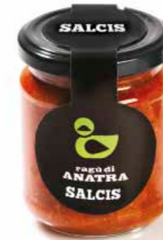
Ragù di Anatra RG002 gr. 180