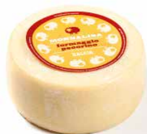
Monnalisa formaggio pecorino ML001 Kg. 1,5