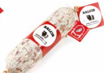
Salamino da "Cinta senese DOP" CS002 gr. 500