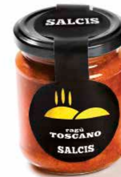
Ragù Toscano RG004 gr. 180