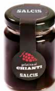
Gelatina al Chianti GCH01 gr. 110