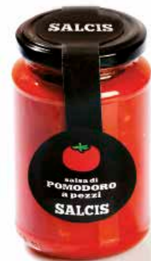
Pomodoro a pezzi PM001 gr. 340