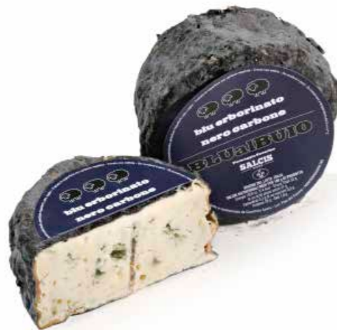
Blu al Buio BB001 Kg. 0,7