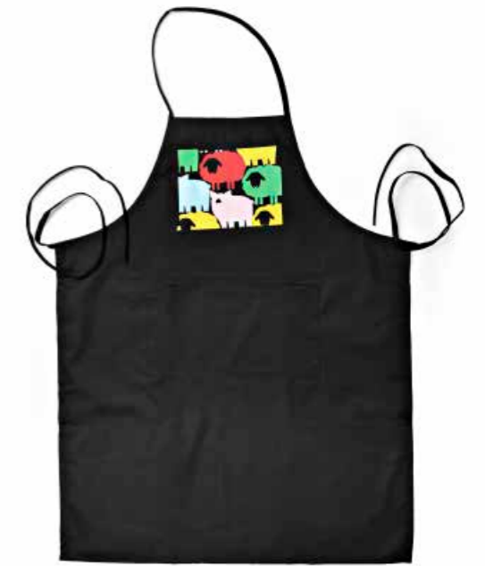
Grembiule a colori nero GRMP2