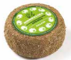
Aromatizzato alle Erbette ML055 gr. 500