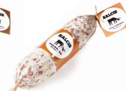
Salamino di Cervo CV001 gr. 500