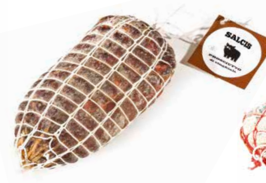
Prosciutto di Cinghiale disossato CGS04 Kg. 2