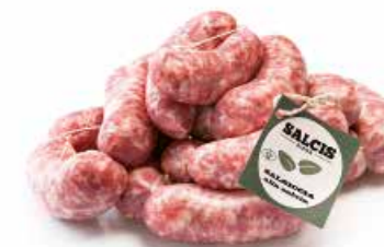
Salsiccia alla salvia SF006