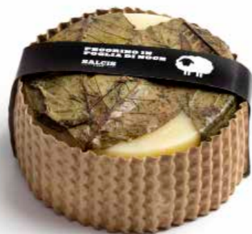
Pecorino Sotto Foglie di Noce cod MLC82AS gr 500