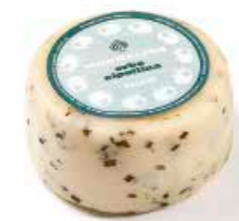
Monnalisa Erba Cipollina ML045 gr. 500