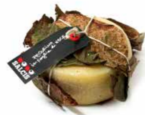
Pecorino sotto Foglie di Noce MLC82 gr. 500