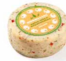
Monnalisa Aglio, Olio e Peperoncino ML040gr. 500