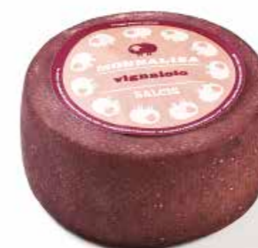
Monnalisa "Vignaiolo" sotto mosto ML081 Kg. 1,5