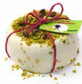
Monnalisa Fiorita al pistacchio MLPS58 Kg. 0,3