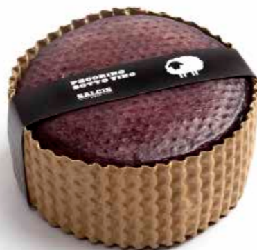
Pecorino Sotto Vino cod MLC81AS gr 500