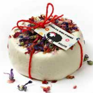
Figlia dei fiori MLF58 Kg. 0,3