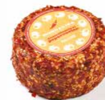
Aromatizzato al Peperoncino ML052 gr. 500