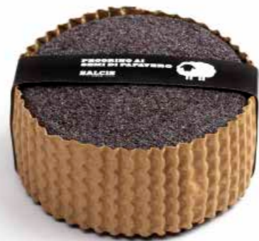
Pecorino ai Semi di Papavero cod MLC30AS gr 500