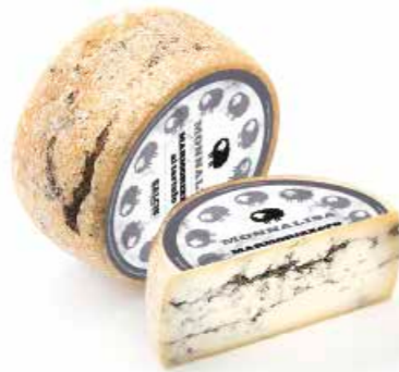
Marmorizzato al tartufo ML090 Kg. 2,6