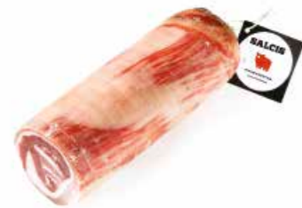
Pancetta arrotolata PA001 Kg. 3,5