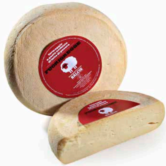
Fuorigregge formaggio a pasta occhiata ML094 Kg. 6