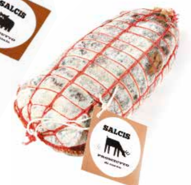
Prosciutto di Cervo disossato CVS02 Kg. 2