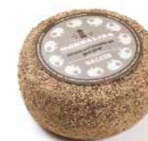
Aromatizzato al Pepe ML053 gr. 500