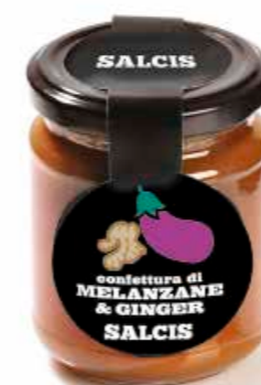
Confettura di Melanzane e Ginger C019 gr. 212 C019P gr. 40