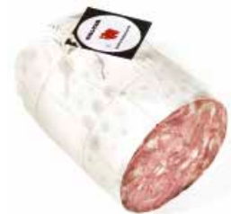
Soppressata in carta SP001 Kg. 5 / 6