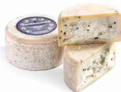
Pecorino Quattro Pepi ML038 Kg. 1,8