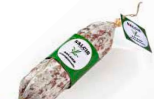
Salame al Dragoncello SL013 gr. 500