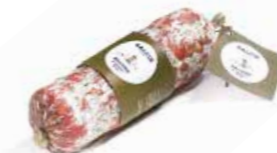
Salame ai Quattro Pepi SL009 gr. 500