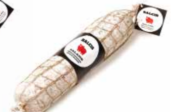
Salamino toscano SL002 Kg. 1