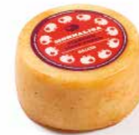
Monnalisa Rigatino tinto rosso ML039 gr. 500