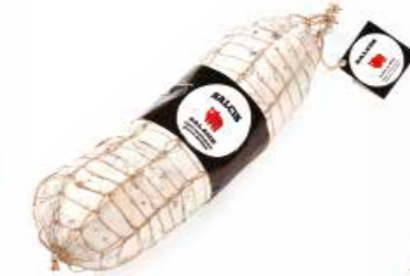
Salame toscano SL001 Kg. 2,7