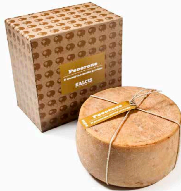
Pecorone ML092 Kg. 12