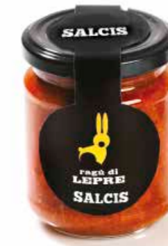
Ragù di Lepre RG005 gr. 180