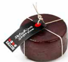
Pecorino sotto Vino MLC81 gr. 500