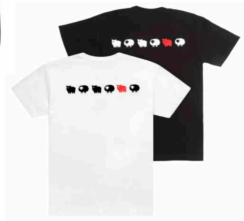
T-shirt Bianca MGB01 T-shirt Nera MGN01