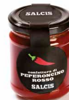
Confettura di Peperoncino Rosso C013 gr. 212 C013P gr. 40