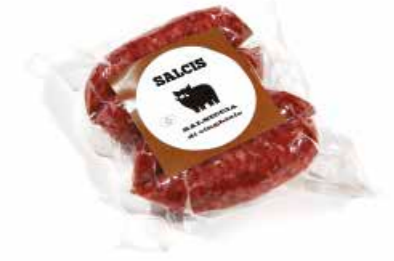
Salsiccia di Cinghiale in bustina CGB01