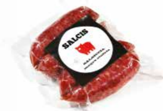
Salsiccia magra stufata bustina 4 pz. sottovuoto SMB01