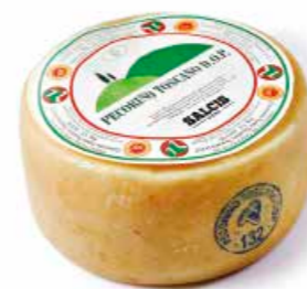
Pecorino DOP fresco DP01 Kg. 1,5