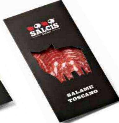
Salame Toscano in astuccio s.v. SLAS01 Gr. 80