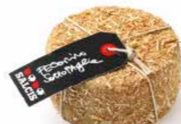
Pecorino sotto Paglia MLC88 gr. 500