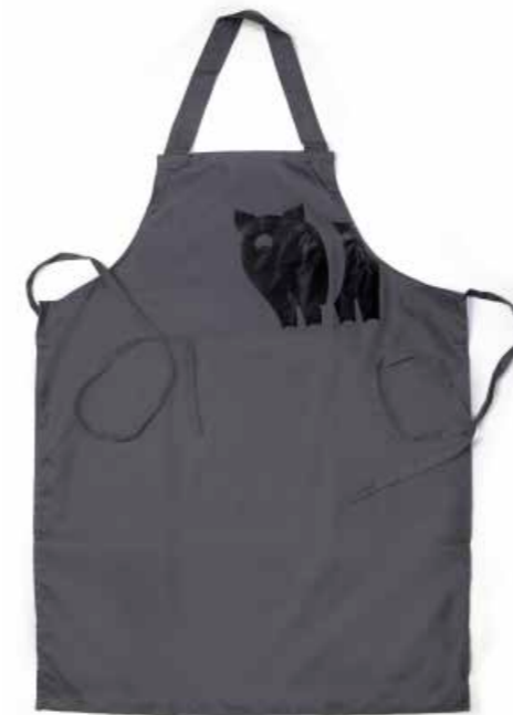
Grembiule Maiale Cinta GRM01