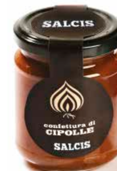
Confettura di Cipolla C015 gr. 212 C015P gr. 40