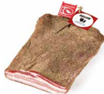
Pancetta tesa da "Cinta senese DOP" CS004 Kg. 2