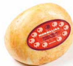
Monnalisa Marzolino tinto rosso ML004 Kg. 1