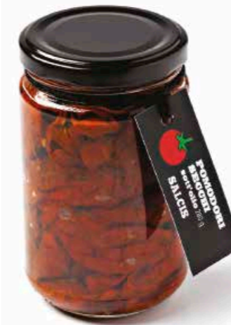
Pomodori Secchi sott'olio S002 gr. 280