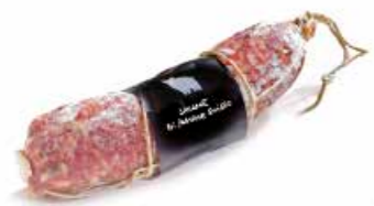
Salamino di Maiale Grigio SL099 gr. 500