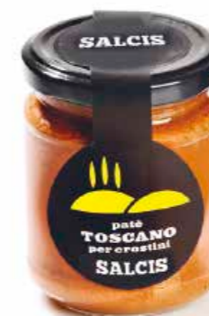
Patè toscano per crostini P004 gr. 180