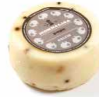
Monnalisa al Pepe MLP41 gr. 500