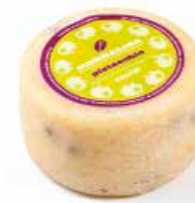
Monnalisa Pistacchio ML047 gr. 500