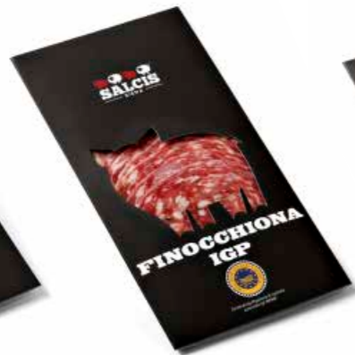
Finocchiona IGP in astuccio s.v. FNAS01 Gr. 80