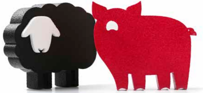
Sagoma Pecora SGP01