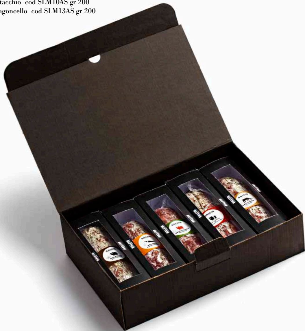
Box Salamini Mignon BOXSAL