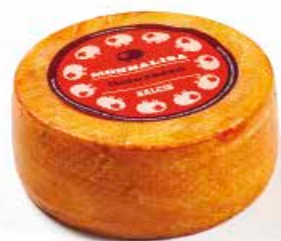
Monnalisa tinto rosso ML002 Kg. 1,4