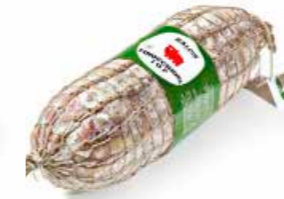
Finocchiona IGP FN001 Kg. 2,7