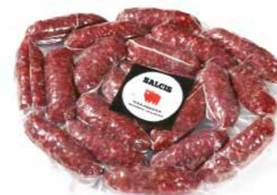
Salsiccia magra stufata sottovuoto SMV01 Kg. 1