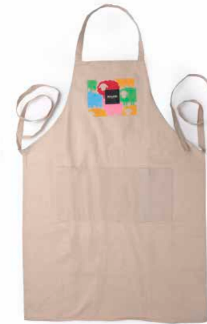
Grembiule a colori ecru GRMP3