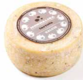
Monnalisa Tartufo MLT43 Kg. 1