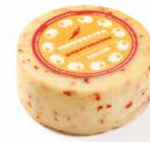
Monnalisa al Peperoncino MLP42 gr. 500