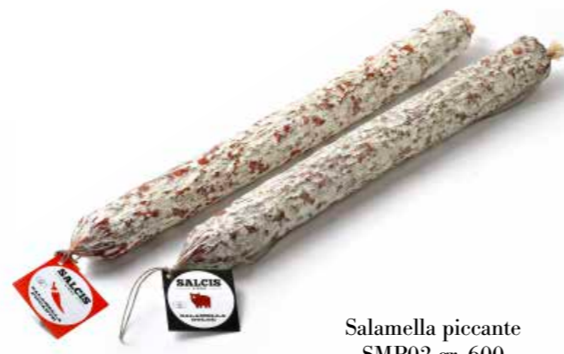
Salamella piccante SMP02 gr. 600 Salamella dolce SMD02 gr. 600