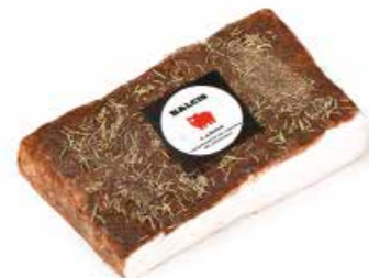
Lardo stagionato in conca di marmo LD001 Kg. 2,5 LDT01 in tranci Kg. 0,4