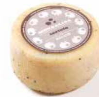
Monnalisa al Tartufo ML043 gr. 500