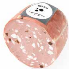
Mortadella al Tartufo MT001 Kg. 5 MTP01 Kg. 2