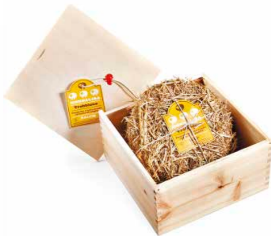
Monnalisa "Trebhone" a latte crudo ML088 Kg. 2,6