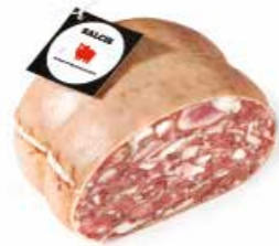
Soppressata in cotenna SP002 Kg. 8