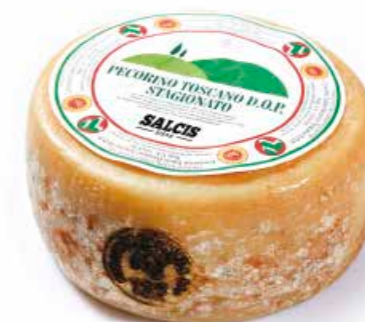
Pecorino DOP stagionato DP02 Kg. 2,6