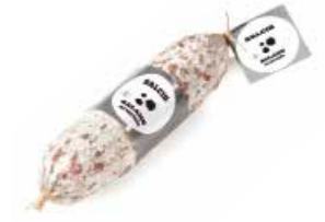
Salame al Tartufo SL005 gr. 500