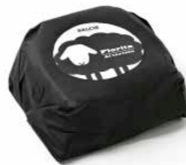
Monnalisa Fiorita al tartufo MLT58 Kg. 0,3