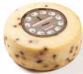
Monnalisa Pepe ML041 Kg. 1