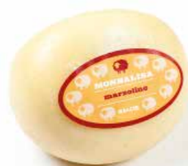
Monnalisa Marzolino ML003 Kg. 1