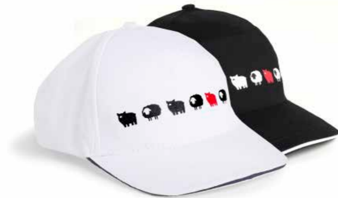
Cappellino Bianco CAPB1 Cappellino Nero CAPN1