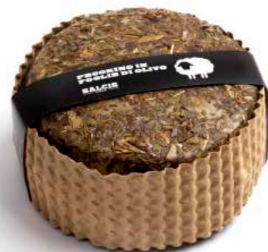
Pecorino in Foglie di Olivo cod MLC50AS gr 500