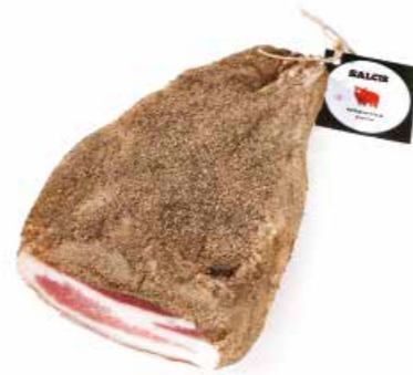
Guancia pepata GC001 Kg. 1,5