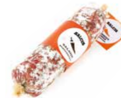
Salame al Peperoncino SL006 gr. 500