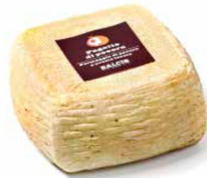
Fagotto di Pecora MLFG1 Kg. 0,5