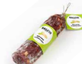
Salame al Pistacchio SL010 gr. 500