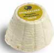
Ricottina Stagionata RST01 gr. 180