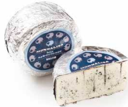
Monnalisa Blu Erborinato ML051 Kg. 3