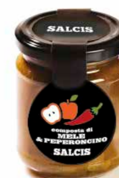
Confettura di Mele e Peperoncino C020 gr. 212 C020P gr. 40