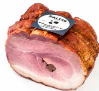
Prosciutto cotto al Tartufo PGT01 Kg. 4