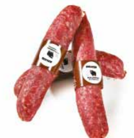
"Cinghialino" CG003 gr. 200