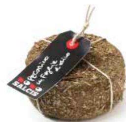
Pecorino in foglie di Olivo MLC50 gr. 500