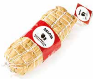
Capocollo da "Cinta senese DOP" CS005 Kg. 1,5