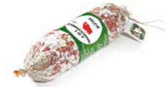
Finocchiona IGP FN002 gr. 500