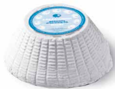
Ricotta R001 Kg.1,7 Ricotta piccola R002 gr. 400