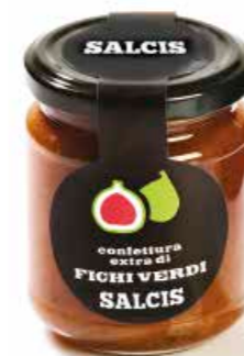
Confettura Extra di Fichi Verdi C003 gr. 212 C003P gr. 40