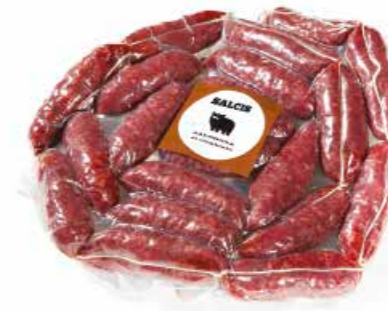
Salsiccia di Cinghiale sottovuoto CGV01 n.20x Kg. 1