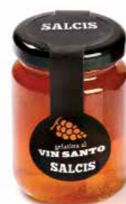
Gelatina al Vin Santo GVS01 gr. 110