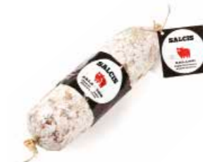
Salamino toscano SL003 gr. 500