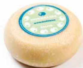
Monnalisa Scodellato ML005 Kg. 1,3