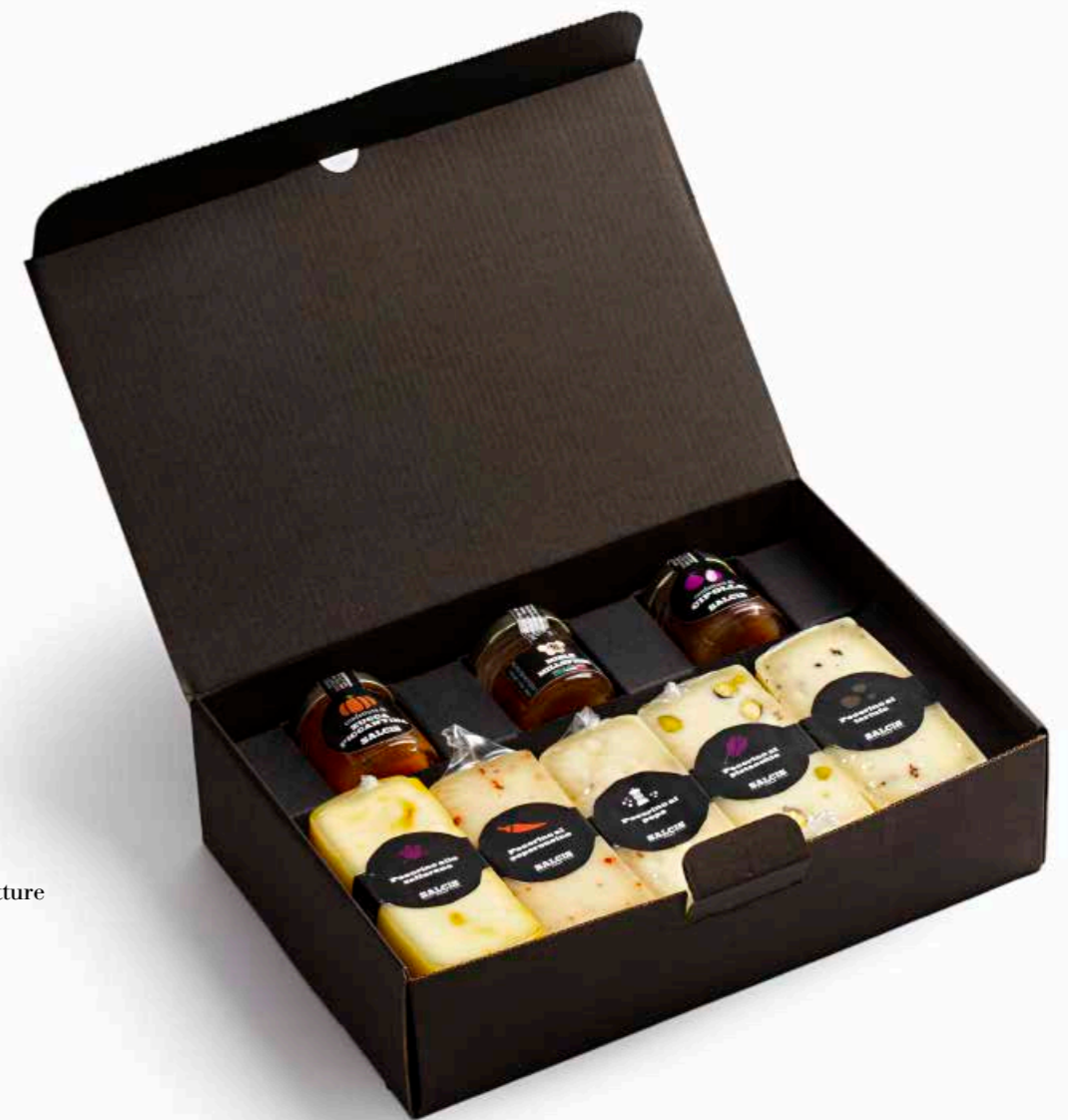
Box Pecorini e Confetture BOXFOR