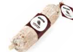
Salame al Chianti SL004 gr. 500