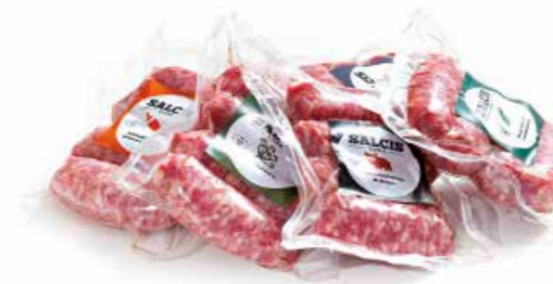
Salsiccia 4 pezzi sottovuoto gr. 300 Siena SFB01 Peperoncino SFB02 Rosmarino SFB03 Finocchio SFB04 Tartufo SFB05 Salvia SFB06