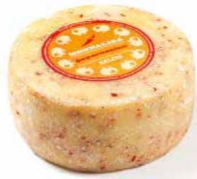
Monnalisa Peperoncino ML042 Kg. 1