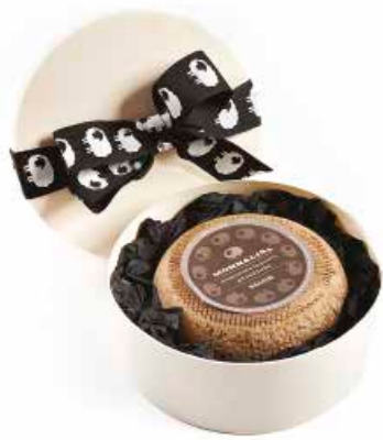
Monnalisa al tartufo stagionato in grotta MLC43 confezione regalo Kg. 1