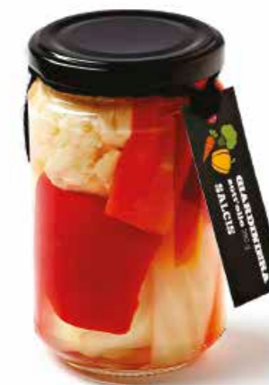
Giardiniera S008 gr. 250