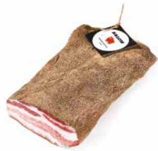
Pancetta tesa affumicata PT002 Kg. 2,5