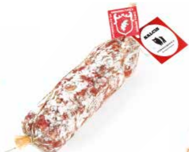
Briciolona da "Cinta senese DOP" CS007 gr. 500