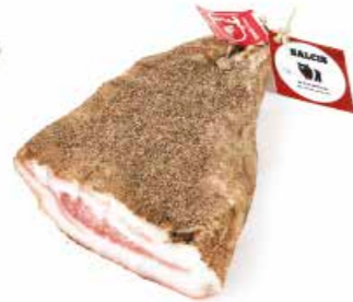
Guancia da "Cinta senese DOP" CS008 Kg. 1