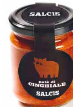
Patè di Cinghiale P003 gr. 180