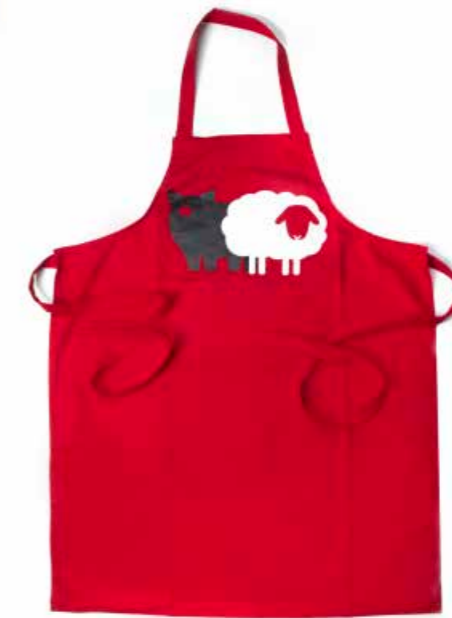
Grembiule Pecora e Maiale GRMP1