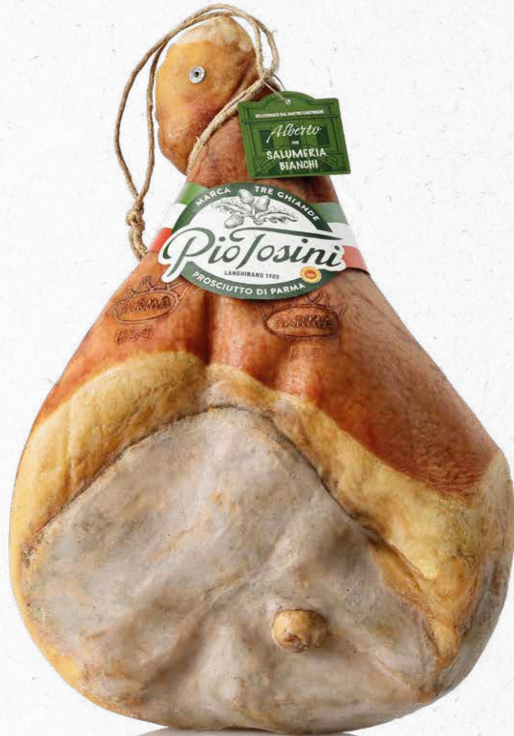
PROSCIUTTO DI PARMA TRE GHIANDE CON OSSO