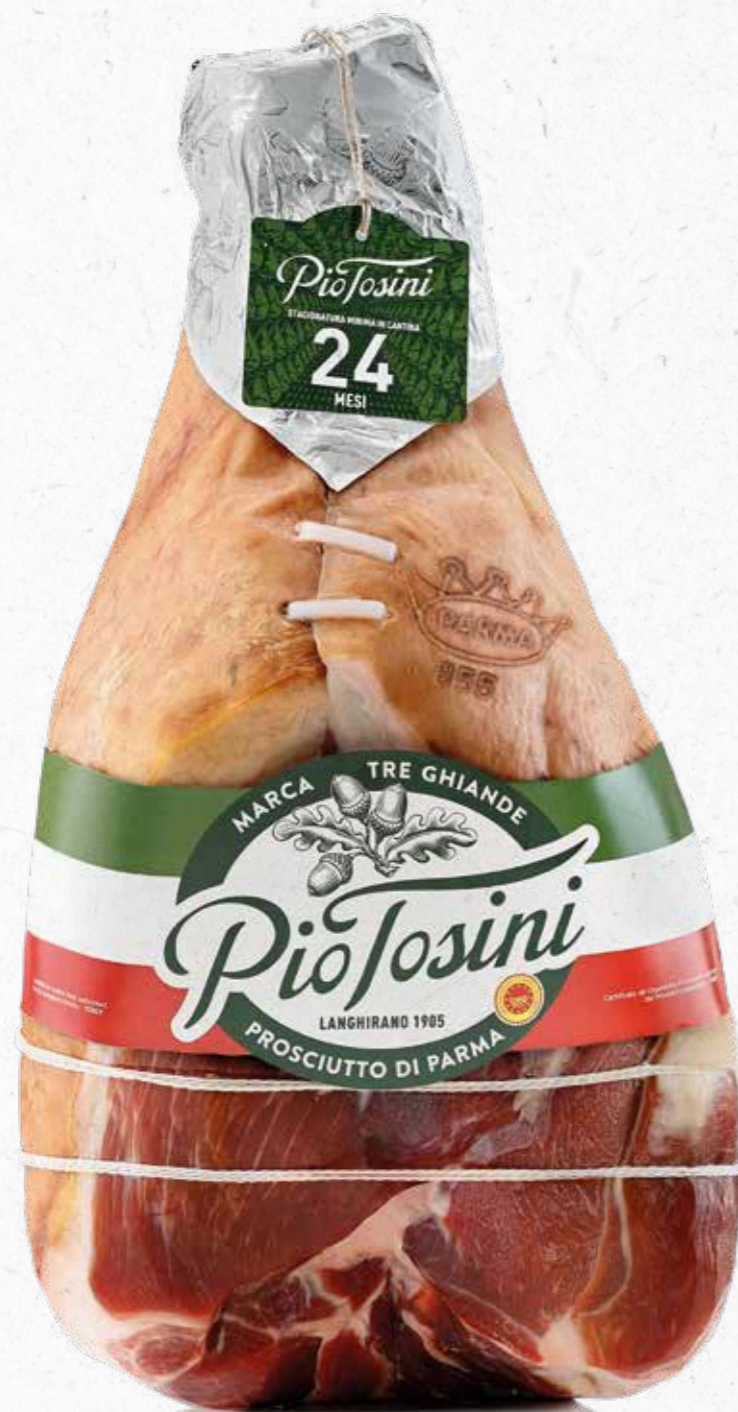
PROSCIUTTO DI PARMA TRE GHIANDE DISOSSATO ADDOBBO