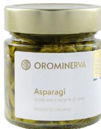
Asparagi 210 g Code STA03