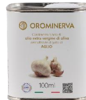
Aglio 100 ml Code AAG01