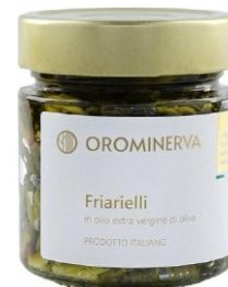
Friarielli 210 g Code STBR03