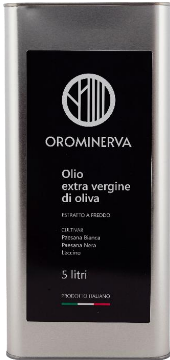
5 L Code EL06