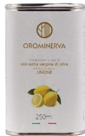
Limone 250 ml Code ALI02