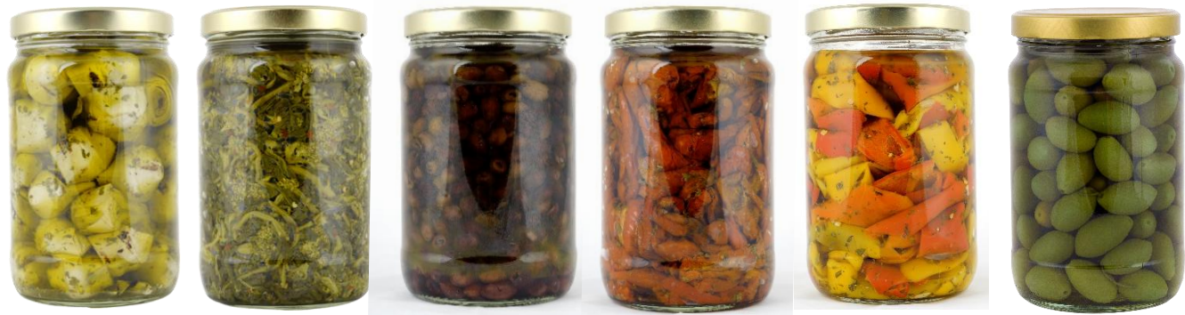
Vasi da 1,500 g