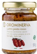
Pesto di pomodori secchi 90 g Code PER01