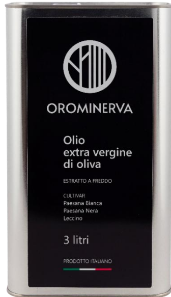
3 L Code EL05