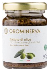
Battuto di olive 90 g Code CRO01