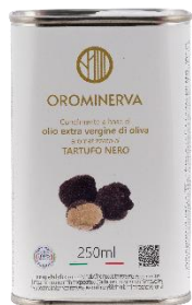
Tartufo nero 250 ml Code ATN02