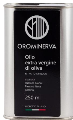
0,25 L Code EL02