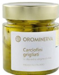
Carciofini grigliati 210 g Code STB03