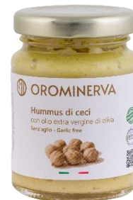
Hummus di ceci 90 g Code HUM01