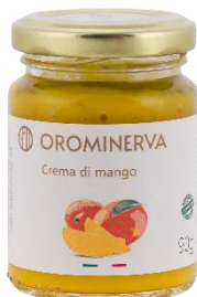
Crema di mango 90 g Code CRM01