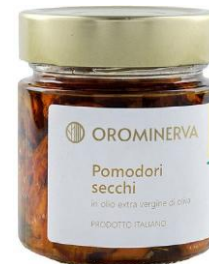
Pomodori secchi 210 g Code STP03