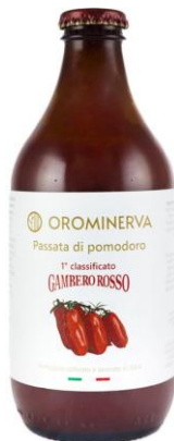
Passata di pomodoro 330 g Code PAS02