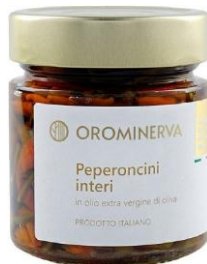
Peperoncini interi 210 g Code STPP03