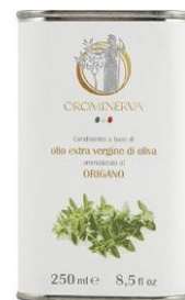
Origano 250 ml Code AOR02