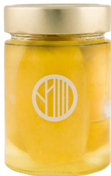
Limone Confit 300 g Code LIMCO01