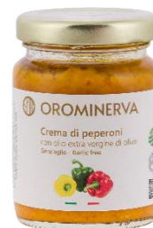
Crema di peperoni 90 g Code CRPE01