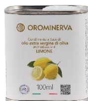
Limone 100 ml Code ALI01