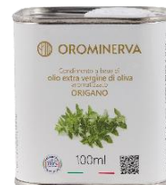
Origano 100 ml Code AOR01