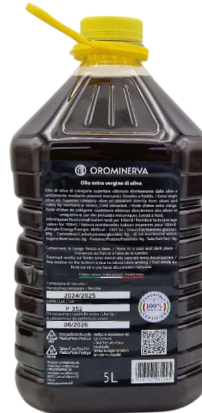
5 L Code EL06P