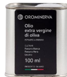
0,10 L Code EL01