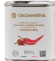
Peperoncino 100 ml Code APP01