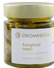
Funghetti interi 210 g Code STFP03