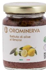
Battuto di olive al limone 90 g Code CROL01