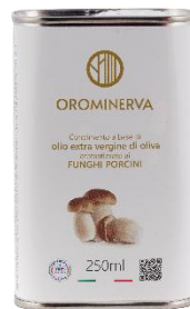
Funghi porcini 250 ml Code AFP02