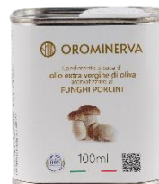
Funghi porcini 100 ml Code AFP01