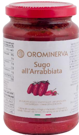
Sugo all'arrabbiata 350 g Code SUG01

PBA free e senza acido citrico per offrire un prodotto di qualità come da tradizione Orominerva.