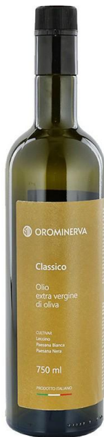
Classico 750 ml Code EC04

Cultivar: Leccino, Paesana Bianca e Paesana Nera. Olio molto duttile, da usare sia a crudo che in cucina. Fruttato leggero, gradevole, con sentori di carciofo e di mandorla cruda. Note di verde e riflessi giallo dorato.