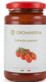
Datterini paesani 360 g Code DAT01