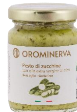
Pesto di zucchine 90 g Code PEZ01