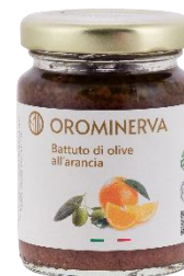
Battuto di olive all'arancia 90 g Code CROA01