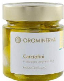
Carciofini 210 g Code STC03