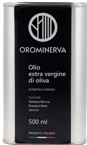
0,50 L Code EL03