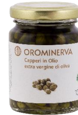
Capperi in olio EVO 100 g Code CAP03