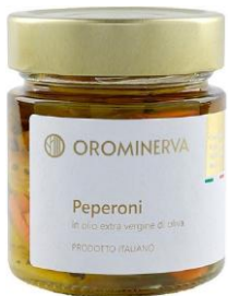
Peperoni 210 g Code STPE03