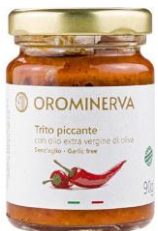
Trito piccante 90 g Code CRP01