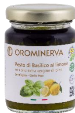
Pesto di basilico e limone 90 g Code PEBL01