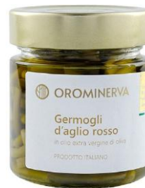
Germogli d'aglio rosso 210 g Code STGA03