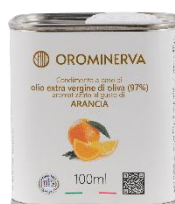
Arancia 100 ml Code AAR01