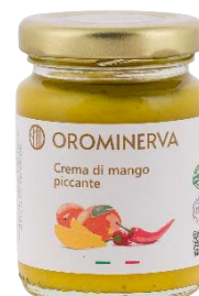
Crema di mango piccante 90 g Code CRMP01