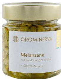
Melanzane 210 g Code STM03