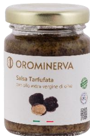
Salsa tartufata 90 g Code SALTAR01