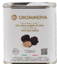
Tartufo nero 100 ml Code ATN01