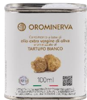
Tartufo bianco 100 ml Code ATB01