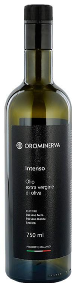
Intenso 750 ml Code EI04