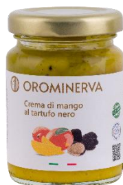
Crema di mango al tartufo 90 g Code CRMT01