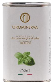
Basilico 250 ml Code ABA02