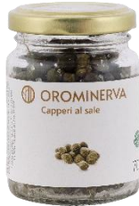
Capperi al sale 70 g Code CAP01