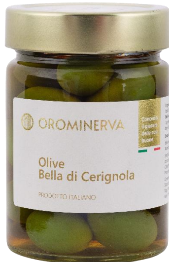
Olive Bella di Cerignola 330 g Code OBC01

Le olive Bella di Cerignola selezionate da Orominerva sono una delle varietà più pregiate e iconiche della tradizione italiana.