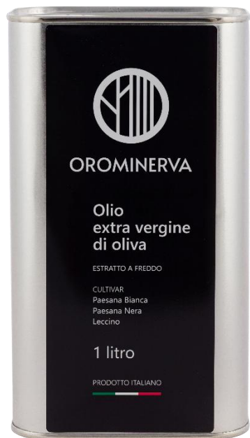
1 L Code EL04