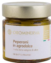
Peperoni in agrodolce 210 g Code STPEA03