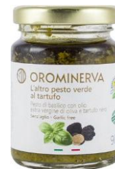
L'altro pesto verde al tartufo 90 g Code PEBT01