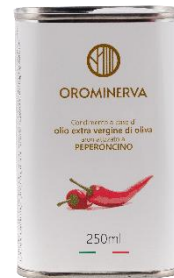
Peperoncino 250 ml Code APP02