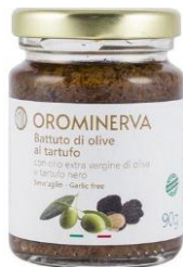
Battuto di olive al tartufo 90 g Code CROT01