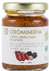
L'altro pesto rosso al tartufo 90 g Code PERT01