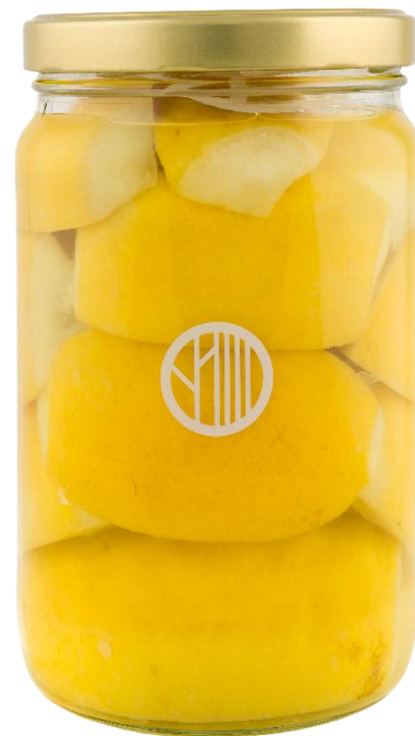
Limone Confit 1500 g Code LIMCO02