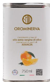
Arancia 250 ml Code AAR02