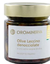
Olive Leccino denocciolate 210 g Code STLD03