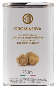
Tartufo bianco 250 ml Code ATB02