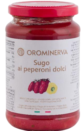
Sugo ai peperoni dolci 350 g Code SUG03