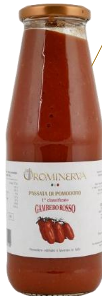
Passata di pomodoro 680 g Code PAS03