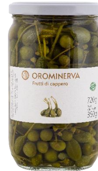
Frutti di capperi 720 g Code CAF02