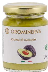
Crema di avocado 90 g Code CRA01