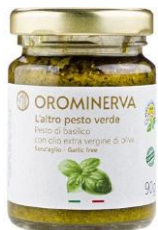
Pesto di basilico 90 g Code PEB01