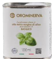
Basilico 100 ml Code ABA01