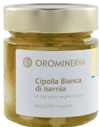
Cipolla bianca di Isernia 210 g Code STCI03