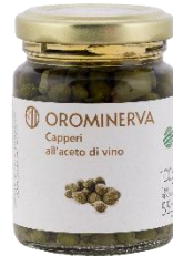
Capperi all'aceto 100 g Code CAP02