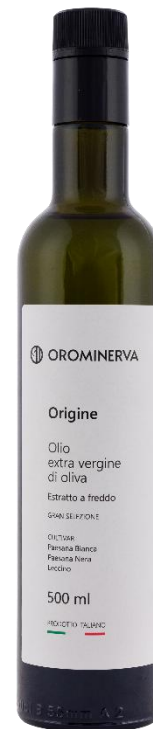
Origine 500 ml Cod. EO03