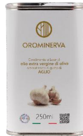
Aglio 250 ml Code AAG02