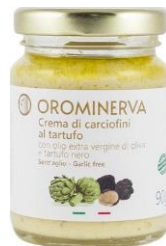
Crema di carciofini al tartufo 90 g Code CRCT01