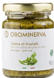
Crema di friarielli 90 g Code CRF01