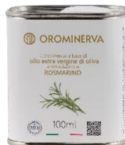
Rosmarino 100 ml Code ARO01