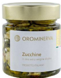
Zucchine 210 g Code STZ03