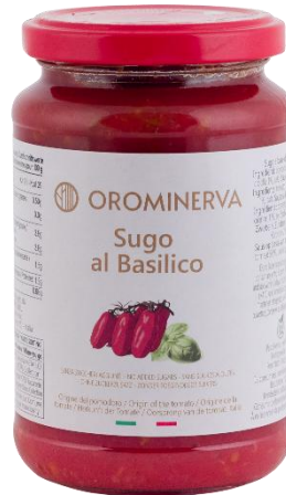
Sugo al basilico 350 g Code SUG02