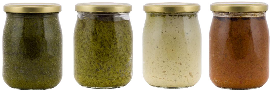
Nuovi vasi da 500 g