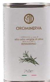
Rosmarino 250 ml Code ARO02