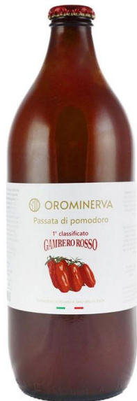
Passata di pomodoro 660 g Code PAS01