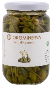
Frutti di capperi 370 g Code CAF01