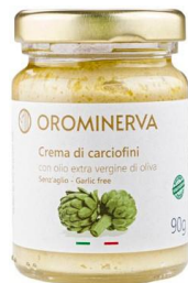
Crema di carciofini 90 g Code CRC01