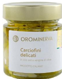
Carciofini delicati 210 g Code STSP03