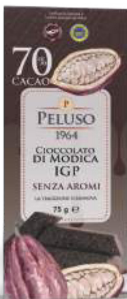
CIOCCOLATO DI MODICA IGP