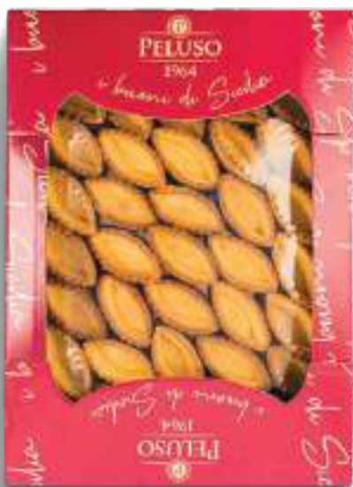
BARCHETTE MIGNON DOLCI 70 pezzi