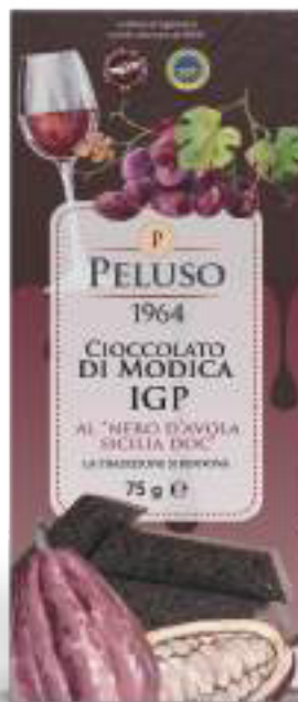
CIOCCOLATO DI MODICA IGP