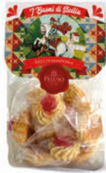
PASTE DI MANDORLA RICCI DI MANDORLA 250 g