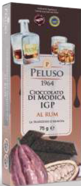
CIOCCOLATO DI MODICA IGP