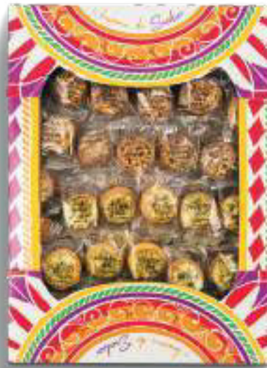
CANESTRINI NOCCIOLA E PISTACCHIO 1250 g