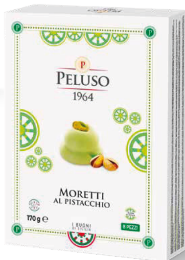
MORETTI AL PISTACCHIO 8 PEZZI - 170 g