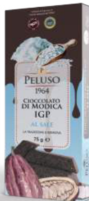
CIOCCOLATO DI MODICA IGP