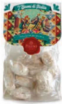
PASTE DI MANDORLA FIOCCHI DI MANDORLA 250 g