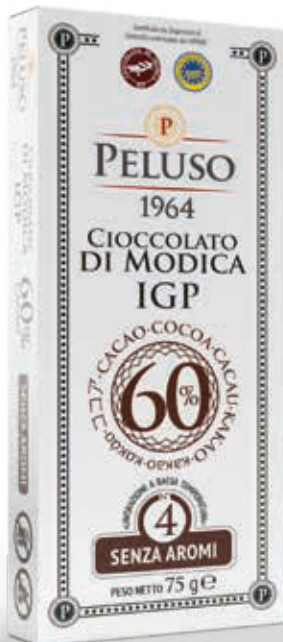
CIOCOLATO DI MODICA IGP CACAO 60% SENZA AROMI - 75 g