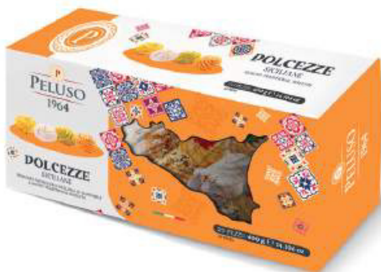
PASTE DI MANDORLA DOLCEZZE SICILIANE 20 PEZZI - 400 g