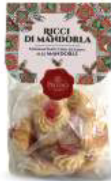
PASTE DI MANDORLA RICCI DI MANDORLA 250 g