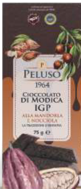
CIOCCOLATO DI MODICA IGP