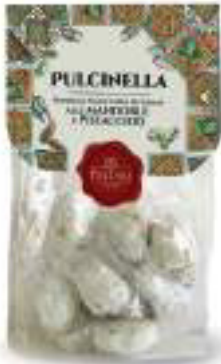
PASTE DI MANDORLA PULCINELLA DI MANDORLE 250 g