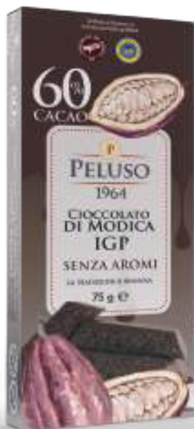
CIOCCOLATO DI MODICA IGP