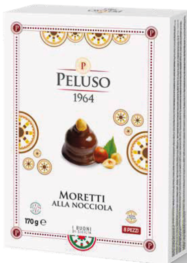
MORETTI ALLA NOCCIOLA 8 PEZZI - 170 g