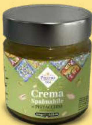
Crema spalmabile al Pistacchio Dolce