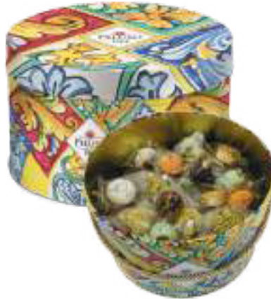
LINEA LATTA IN CERAMICA BISCOTTI