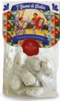
PASTE DI MANDORLA PULCINELLA DI MANDORLE 250 g