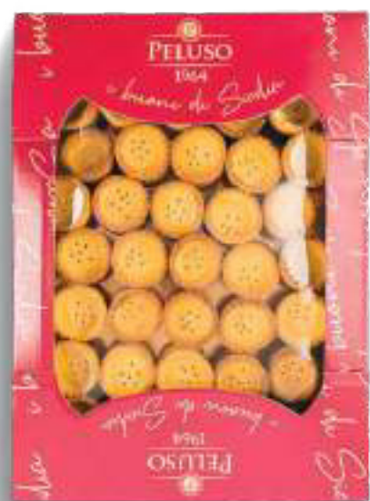
TARLETTE MIGNON DOLCI 70 pezzi