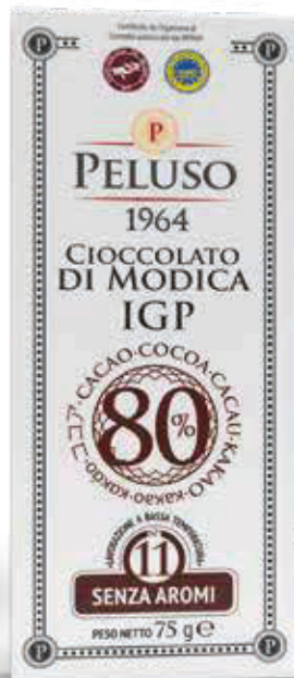
CIOCCOLATO DI MODICA IGP CACAO 80% - 75 g