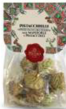
PASTE DI MANDORLA PISTACCHIELLI DI MANDORLA 250 g