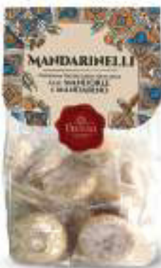
PASTE DI MANDORLA MANDARINELLI 250 g