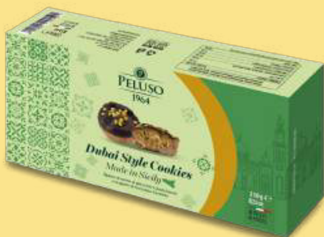
Dubai Style Cookies Ripieno di crema al pistacchio e pasta kataifi e ricoperto di cioccolato fondente