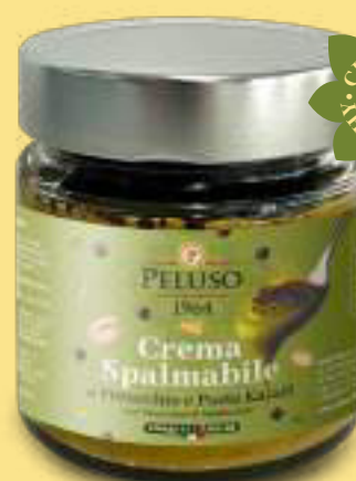
Crema spalmabile al Pistacchio e Pasta Kataifi con "Cioccolato di Modica IGP"