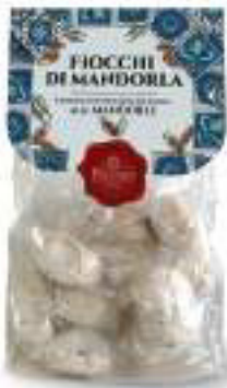
PASTE DI MANDORLA FIOCCHI DI MANDORLA 250 g