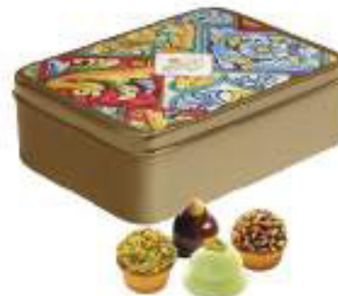
LINEA LATTA IN CERAMICA BISCOTTI