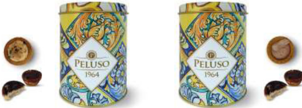
LINEA LATTA IN CERAMICA BISCOTTI