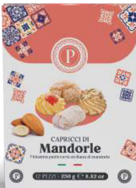
PASTE DI MANDORLA CAPRICCI DI MANDORLE 12 PEZZI - 250 g