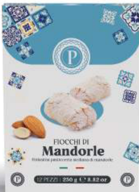
PASTE DI MANDORLA FIOCCHI DI MANDORLE 12 PEZZI - 250 g