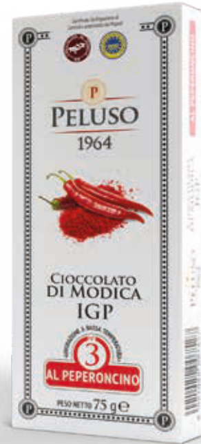
CIOCOLATO DI MODICA IGP AL PEPERONCINO - 75 g