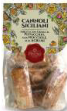
CANNOLI AL LIMONE 250 g