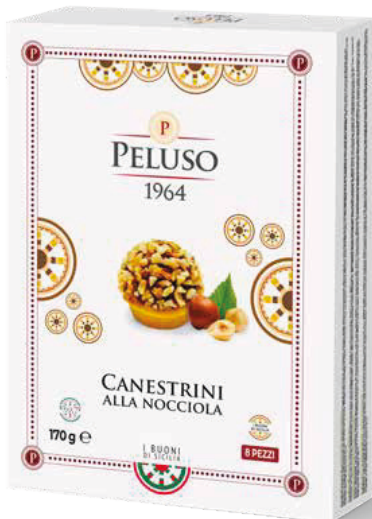
CANESTRINI ALLA NOCCIOLA 8 PEZZI - 170 g