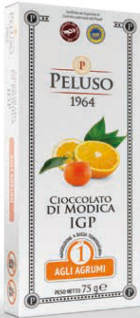
CIOCOLATO DI MODICA IGP AGLI AGRUMI - 75 g