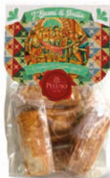
CANNOLI SICILIANI MISTI 250 g