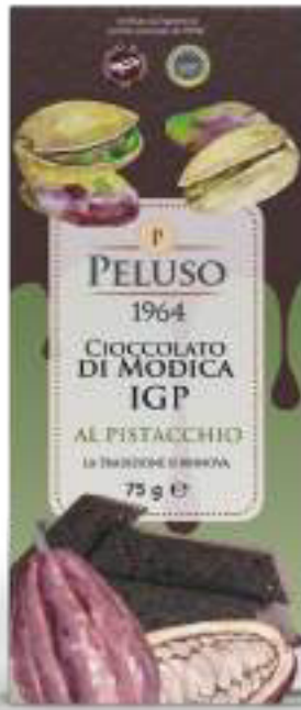
CIOCCOLATO DI MODICA IGP