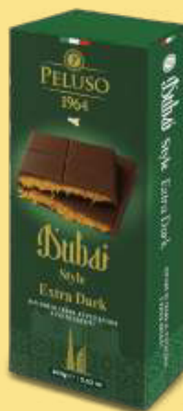
Dubai Style Extra Dark Ripieno di Crema al Pistacchio e Pasta Kataifi tostata