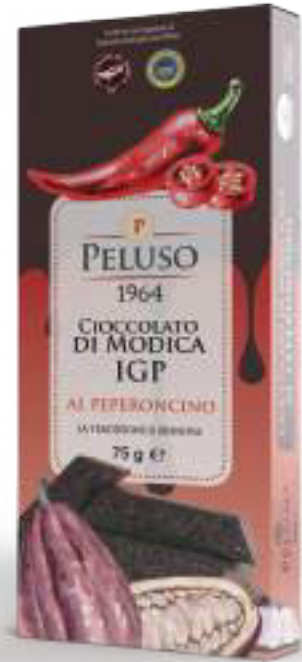
CIOCCOLATO DI MODICA IGP