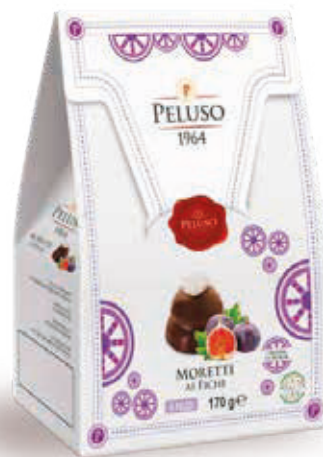
MORETTI AI FICHI 8 PEZZI - 170 g