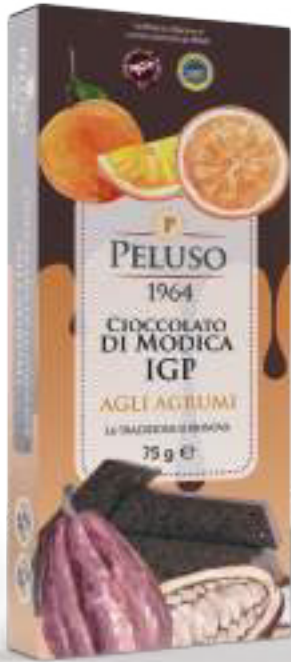
CIOCCOLATO DI MODICA IGP