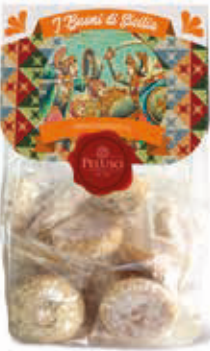
PASTE DI MANDORLA MANDARINELLI 250 g