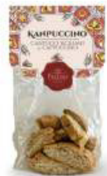
KANPUCCINO - CANTUCCI SICILIANI AL CAPPUCCINO 250 g