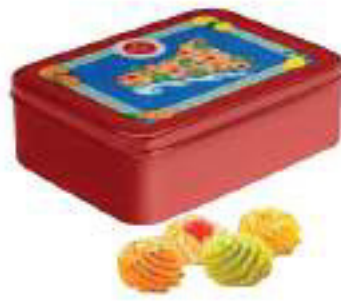
LINEA LATTA IN CERAMICA BISCOTTI