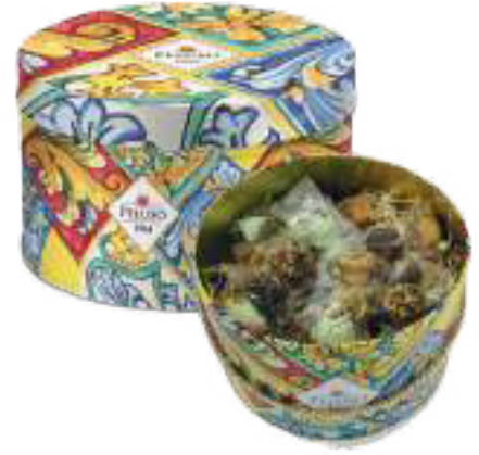
LINEA LATTA IN CERAMICA BISCOTTI