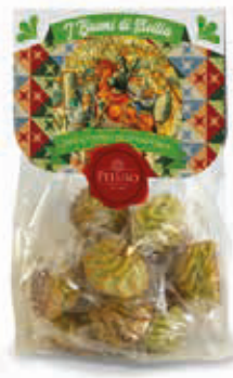
PASTE DI MANDORLA PISTACCHIELLI DI MANDORLA 250 g