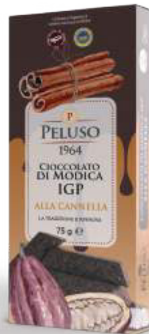
CIOCCOLATO DI MODICA IGP