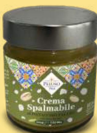
Crema spalmabile al Pistacchio Salato