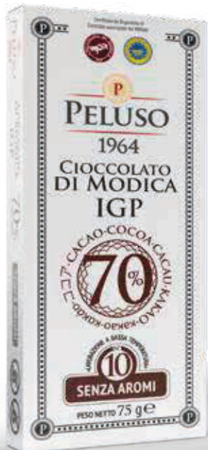
CIOCCOLATO DI MODICA IGP CACAO 70% - 75 g