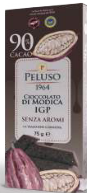
CIOCCOLATO DI MODICA IGP