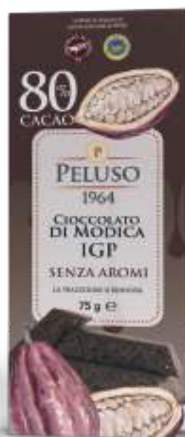
CIOCCOLATO DI MODICA IGP