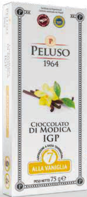
CIOCCOLATO DI MODICA IGP ALLA VANIGLIA - 75 g