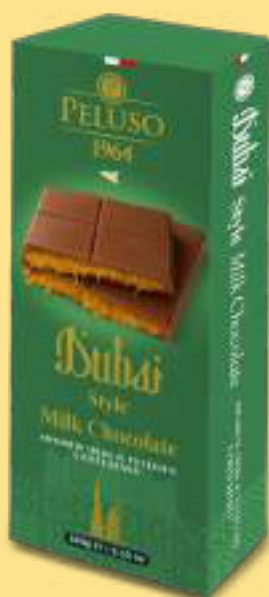
Dubai Style Milk Chocolate Ripieno di Crema al Pistacchio e Pasta Kataifi tostata