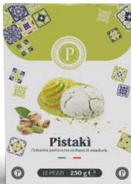
PASTE DI MANDORLA PISTAKÌ 12 PEZZI - 250 g