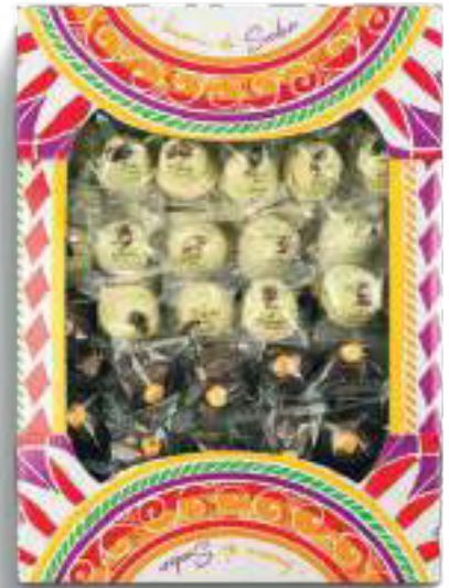
MORETTI NOCCIOLA E PISTACCHIO 1250 g