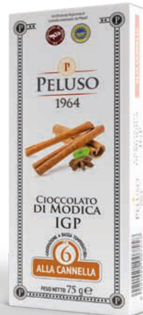
CIOCOLATO DI MODICA IGP ALLA CANNELLA - 75 g