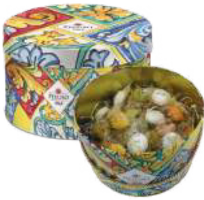
LINEA LATTA IN CERAMICA BISCOTTI