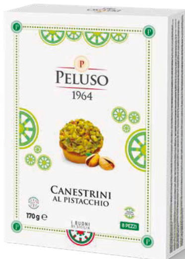
CANESTRINI AL PISTACCHIO 8 PEZZI - 170 g