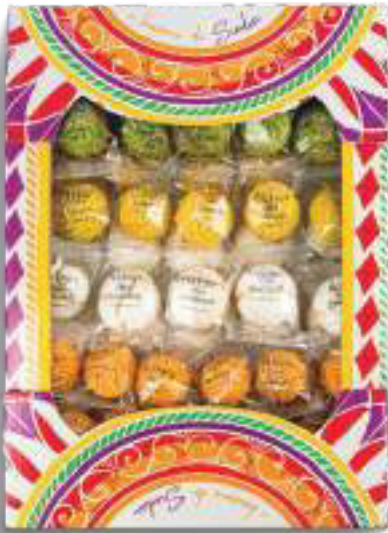
DOLCEZZE DI SICILIA 1250 g