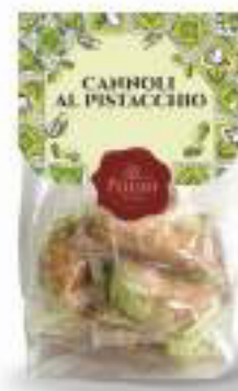
CANNOLI AL PISTACCHIO 250 g