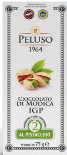
CIOCOLATO DI MODICA IGP AL PISTACCHIO - 75 g