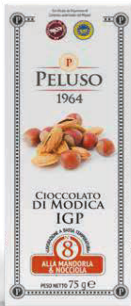
CIOCCOLATO DI MODICA IGP ALLA MANDORLA E NOCCIOLA - 75 g