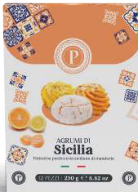
PASTE DI MANDORLA AGRUMI DI SICILIA 12 PEZZI - 250 g