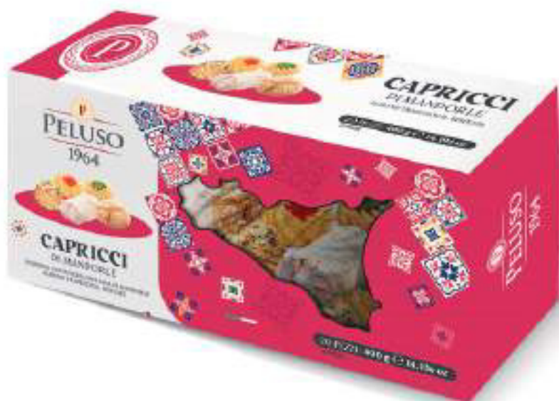
PASTE DI MANDORLA CAPRICCI DI MANDORLE 20 PEZZI - 400 g