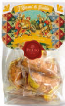
CANNOLI AL LIMONE 250 g