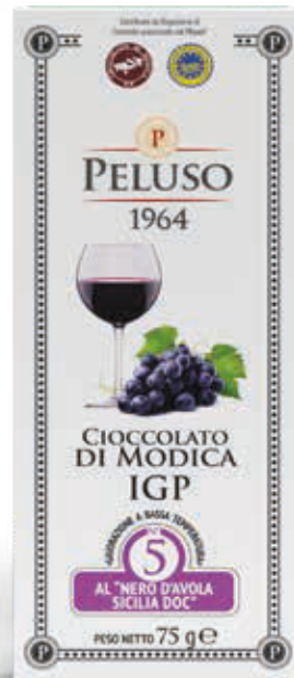
CIOCOLATO DI MODICA IGP AL NERO D'AVOLA SICILIA DOC - 75 g