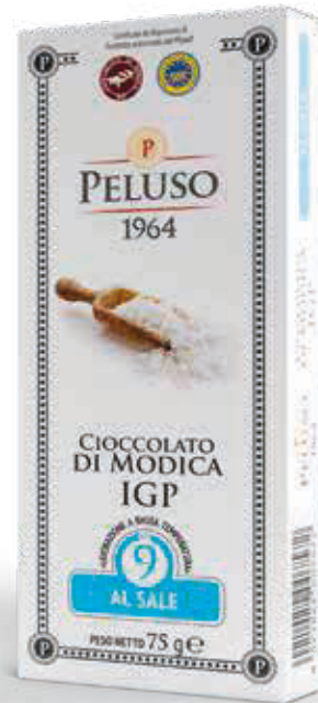
CIOCCOLATO DI MODICA IGP AL SALE - 75 g