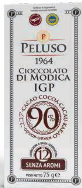
CIOCCOLATO DI MODICA IGP CACAO 90% - 75 g