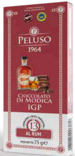
CIOCCOLATO DI MODICA IGP AL RUM - 75 g