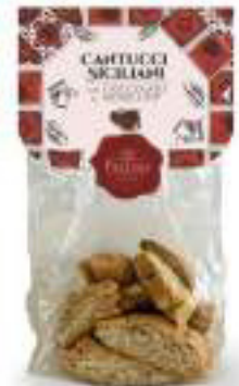
CANTUCCI SICILIANI CON CIOCCOLATO DI MODICA IGP 250 g