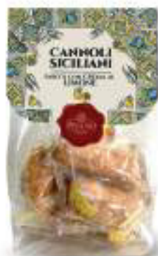
CANNOLI SICILIANI MISTI 250 g