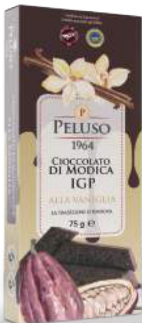
CIOCCOLATO DI MODICA IGP