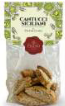
CANTUCCI SICILIANI AL PISTACCHIO 250 g