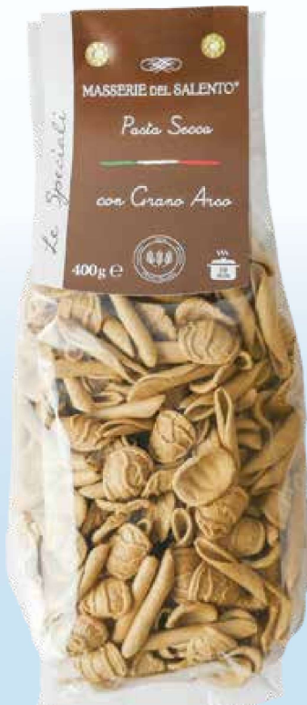
Maritati Sen. Cappelli g. 400